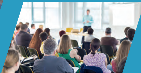
Zertifizierte Aus- und Weiterbildungen auf höchstem Niveau