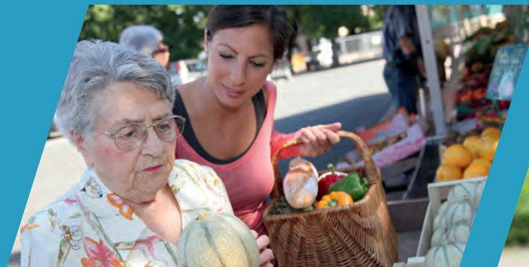
Verantwortung und Freude im Alltag